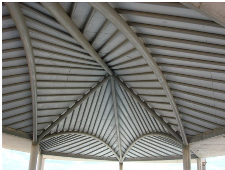
Projeto Marcos Alves de Almeida

Figura 17 – Visão parcial do telhado de tubos de aço e cobertura de cobre. Obra do eng. Carlos Freire, especialista na construção de heliportos e obras civis em geral. O eng. Carlos seguiu à risca o projeto original, construindo o telhado nas proporções harmônicas. Vide site: www.radiestesiaonline.com.br .