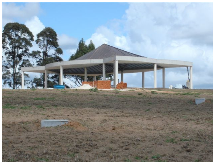
Projeto Marcos Alves de Almeida

Figura 15 - Visão da obra inacabada. Fotografia de nordeste para sudoeste.