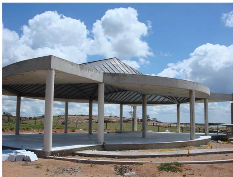
Projeto Marcos Alves de Almeida

Figura 15 - Visão da obra inacabada. Fotografia de nordeste para sudoeste.